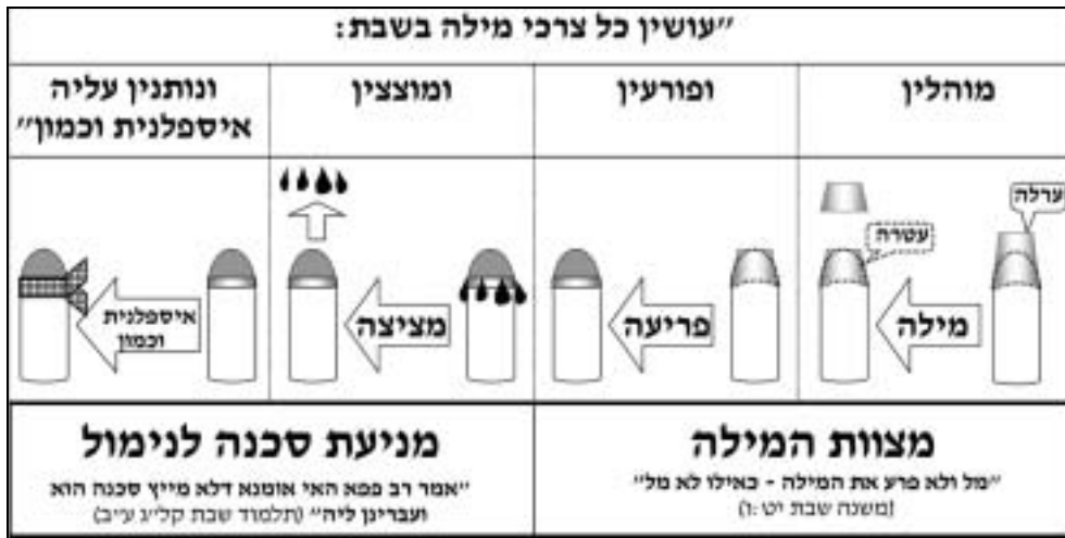
תמונה 1: השלבים של המילה

מנת להציע אפשרות לפיתרונות הלכתיים ולמזער ככל האפשר את הסכנה לבריאות היילוד.