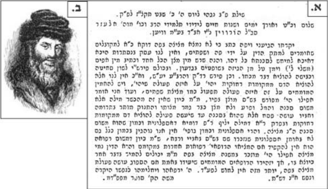
תמונה 2: רבי משה סופר ותשובתו ב"כוכבי יצחק"

בהקדמת העורך לנושא, הוא מתייחס למציצה פומית כמינהג מגעיל ומאוס של היהדות המסורתית, ששורשיו בקרקע מזהמה. שטערן פירסם את מכתבו של פרופ' ורטהיימר, ואת החלטת השלטונות האוסטריים שאין לבצע את המציצה ישירות בדרך פומית כי אם על-ידי ספוג, בגרמנית, ורק אחר כך את ההתכתבות הרבנית בעברית. בנוסף לשיקולים רפואיים-הלכתיים מובהקים, תפיסות אסתטיות של היהודים המשכילים והמתבוללים תפסו מקום חשוב בדיונים אלה מול השלטונות.